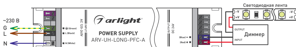
Рис. 2. Схема подключения блока питания к светодиодной ленте через диммер