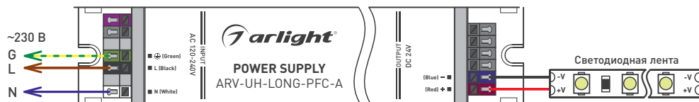
Рис.1. Схема подключения блока питания напрямую к светодиодной ленте