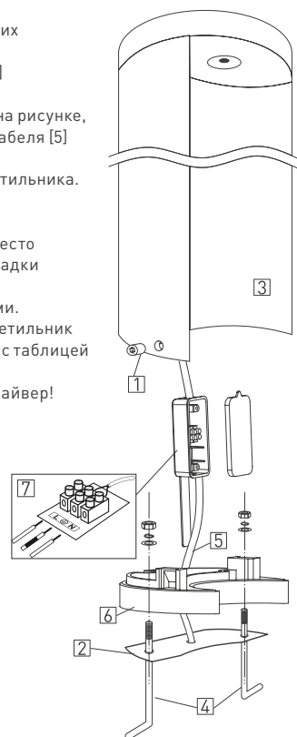
Рис. 2. Установка и подключение светильника