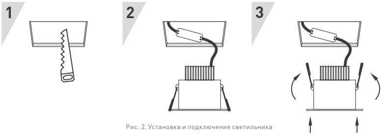
Рис. 2. Установка и подключение светильника